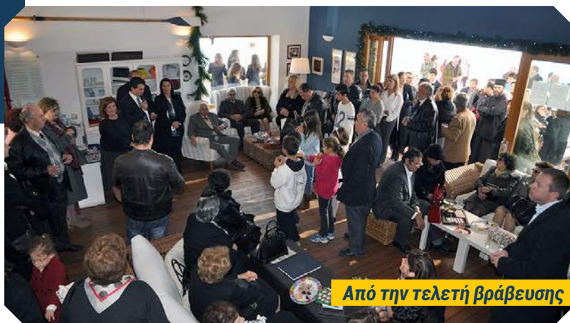
Από την τελετή βράβευσης

Ο πρόεδρος του Ν.Ο.Α. στην σύντομη ομιλία του ανέφερε μεταξύ άλλων: Ο Όμιλος είναι υπερήφανος για την εκμάθηση ιστιοπλοΐας σε μικρούς και μεγάλους καθώς και για τη διδαχή στο να επιζούν στη θάλασσα αλλά και να σέβονται το υγρό στοιχείο. Οι νέοι πλοηγοί γίνονται έτσι οι «Κύριοι του Πεπρωμένου τους». Η ιστιοπλοϊκή ομάδα μας έχει ξεπεράσει τα 30 παιδιά και ευελπιστούμε να συνεχίσουμε να σας κάνουμε υπερήφανους με τα καλά αποτελέσματα στους τοπικούς και διεθνείς αγώνες. Τα παιδιά μαθαίνουν να είναι μία δυνατή ομάδα