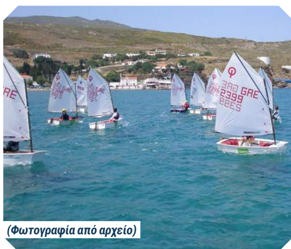
(Φωτογραφία από αρχείο)

Ο Μπίστης Άρης κατέλαβε την 68η θέση στην γενική κατάσταση και 58η στα αγόρια.